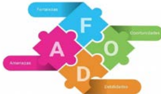
Figura 1. Técnica DOFA. Tomado de