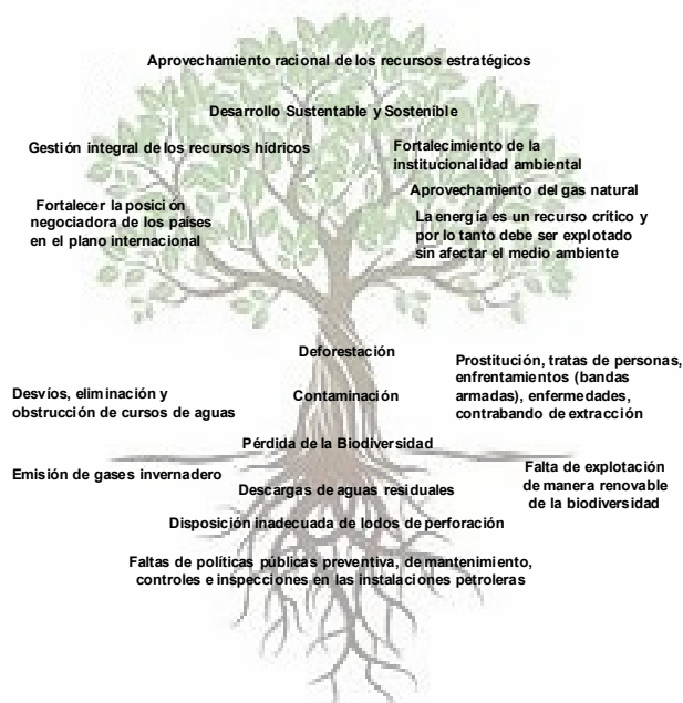
Figura 2. Árbol del Problema. Hallazgos realizados como resultado de la implementación de la técnica DOFA. Elaboración propia, 2024.

En este sentido, el árbol del problema en el momento de diagnóstico permite alcanzar una descripción integral de la realidad del ámbito sobre el cual se desea planificar incorporando la mirada de los actores que conforman ese territorio o tienen incidencia sobre ese sector de la realidad social. Para el diseño de la estrategia, es vital para el establecimiento de líneas de acción consensuadas. Gran parte de la contribución del árbol de problemas es facilitar a los actores el conocimiento de la situación problemática, generando un entendimiento común, así como el análisis de las alternativas de actuación y la viabilidad para desarrollarlas. En este orden, se presenta el árbol del problema (ver figura 2), donde se describen los hallazgos realizados como resultado de la implementación de la técnica DOFA.